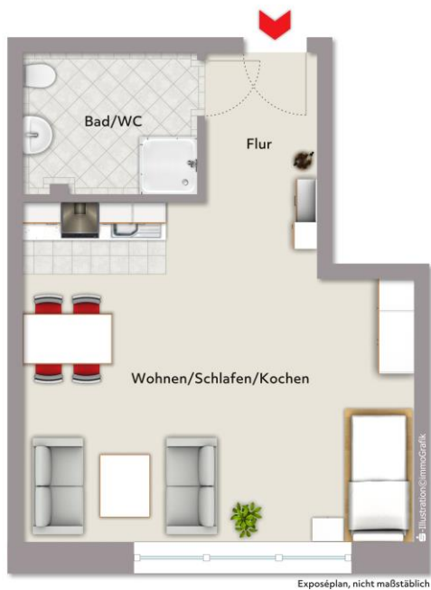
WE 3: 41 m 2 Wohnfläche