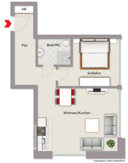
WE 2: 46 m 2 Wohnfläche