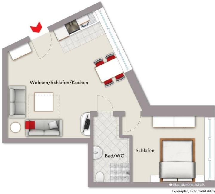
WE 1: 45 m 2 Wfl.