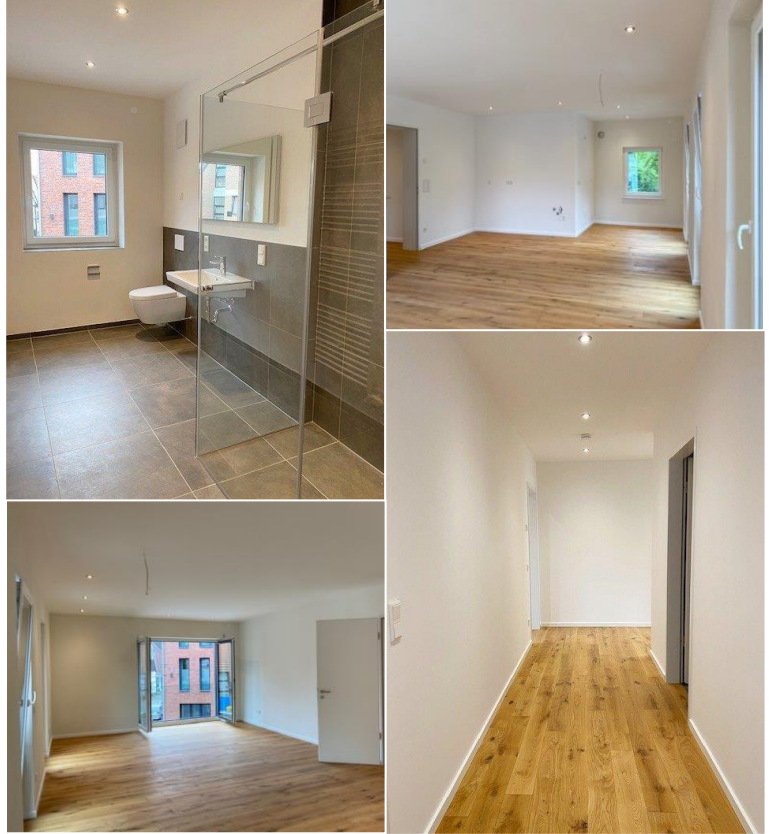
WE 2: 71 m 2 Wohnfläche