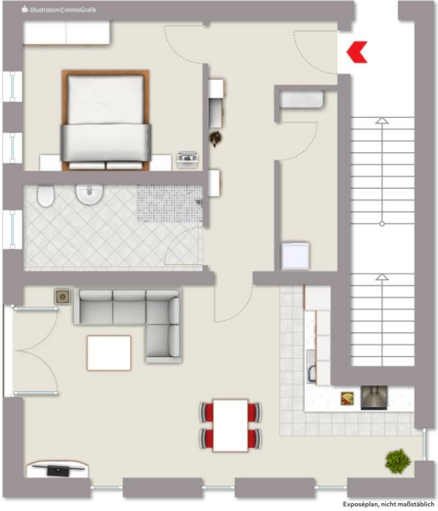
WE 1: 74 m 2 Wfl.